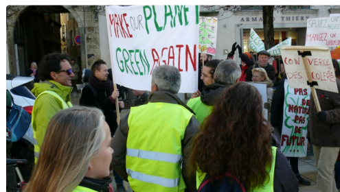
Rencontre place de la Libération entre Gilets jaunes et marcheurs pour le climat.

Alors que certains retournaient au rond-point des Justes pour se retrouver autour des barbecues, d'autres quittaient le lieu pour aller ici et là « au feeling comme le dit un Gilet jaune » vers les ronds-points et en ville. Une technique de manifestation pacifique qui, sans bruit, s'avère efficace pour créer des ralentissements.