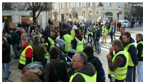
Gilets Jaunes et marcheurs pour le climat sur la place de la Libération.