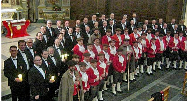
Noël des Orphéons à Plaisance

Concert en l'église samedi 15 décembre à 20 h 30