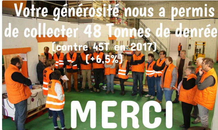
Collecte de la Banque Alimentaire « Un petit exploit dans le contexte ! »

"Avec 48 tonnes de denrées récoltées, je vous confirme une progression de notre collecte de 6,5 % par rapport à 2017. Nous sommes particulièrement heureux de ce résultat dans le contexte que vous connaissez".