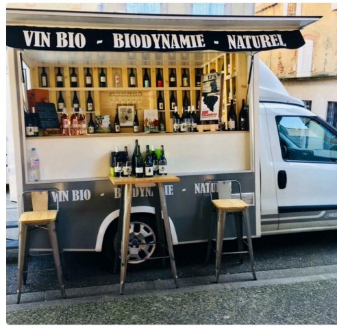
La Caisse à vin sur les marchés gersois