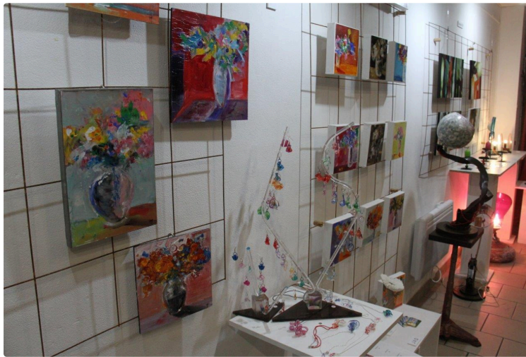
Les Petits formats , idées de cadeaux à la Galerie de Jad