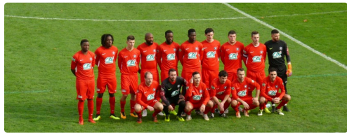
L'équipe auscitaine avant le match.