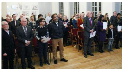
La cérémonie s'est conclue par le chant de l'hymne national, la Marseillaise.