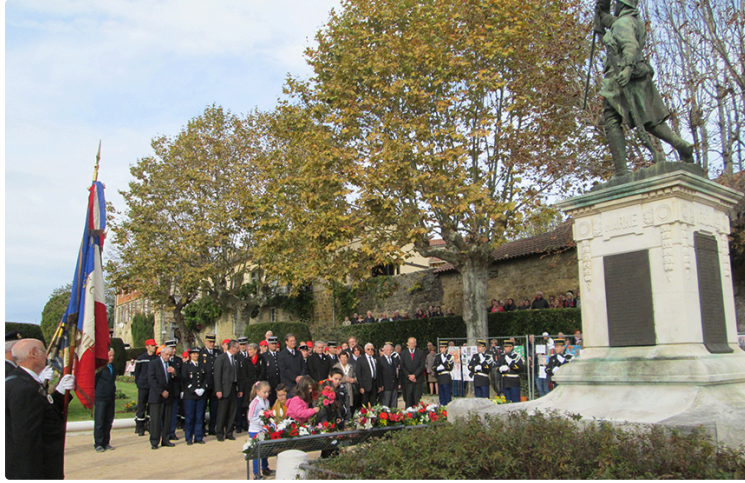
11 novembre cérémonie particulièrement bien suivie dans la sous préfecture