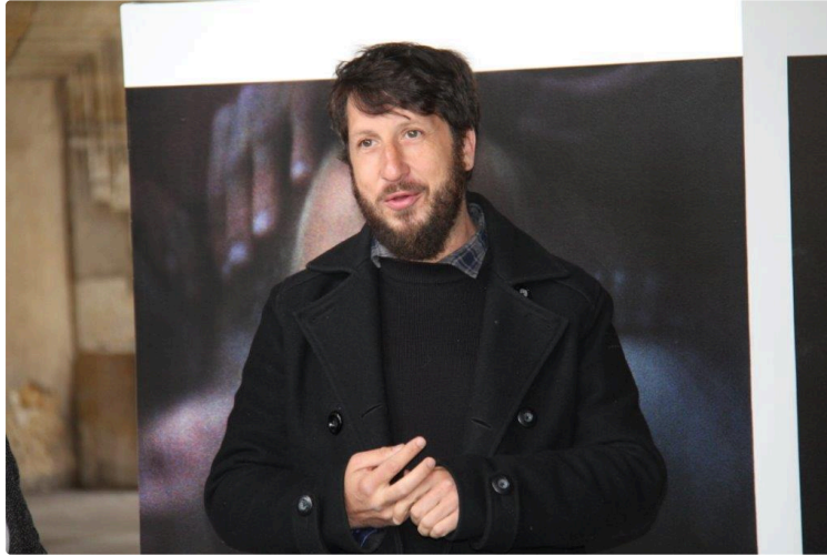
Résidence d'actions culturelles

Le centre d'art et de photographie de Lectoure décale son regard et ses actions dans la communauté de communes de la Ténarèze. Avec également le soutien de la DRAC Occitanie et la ville de Condom, il met en place une résidence d'actions culturelles et une exposition avec le photographe toulousain Arno Brignon.