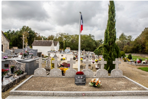
Le carré militaire