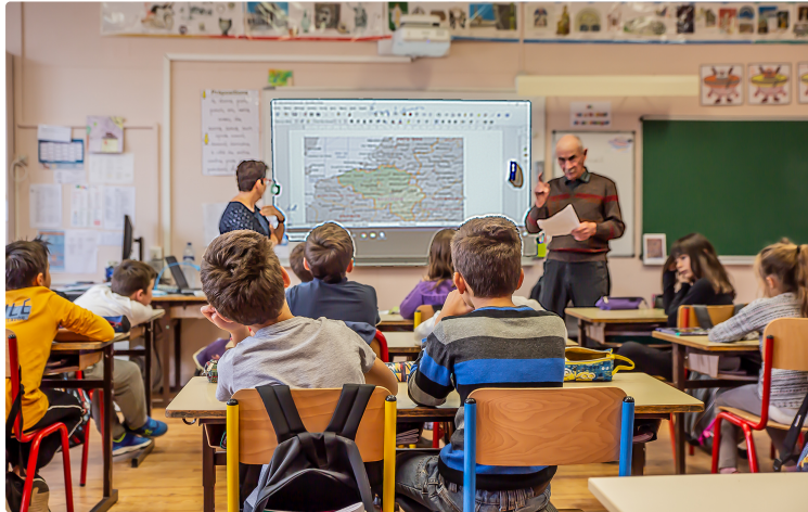
L'école du Houga prépare le 11 novembre