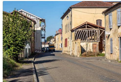
Entrée de Monguilhem vers Villeneuve