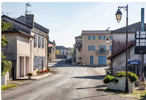
Entrée de Monguilhem vers Nogaro