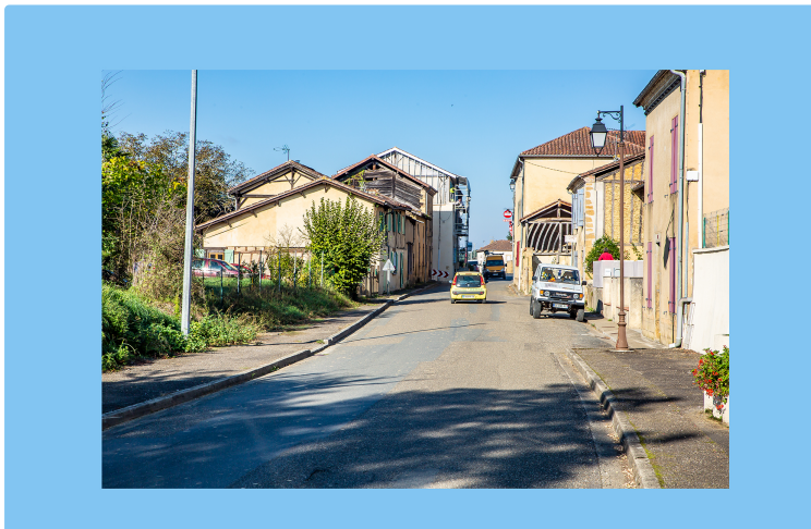
Les projets pour le Budget participatif à Monguilhem

L'une des deux entrées dans le village de Monguilhem est particulièrement étroite et dangereuse. Y installer des radars pédagogiques est donc prioritaire et tout simplement une affaire de sens commun. C'est le projet n°608.