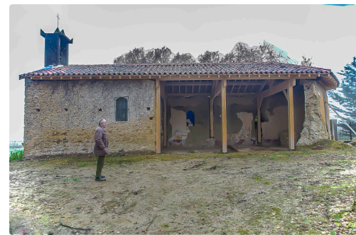
La chapelle de Daunian en cours de rénovation ; au 1er plan, le maire, Jean Duclavé