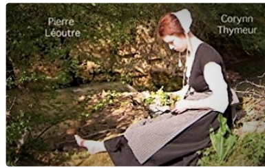
Le surnaturel dans l'histoire au festival Bizarre