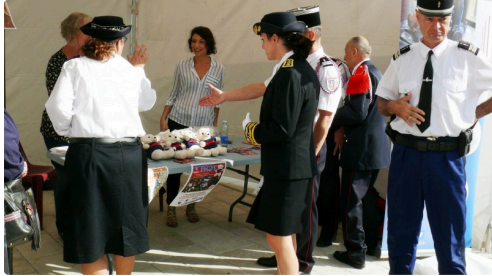
Le stand de la peluche Pompy.