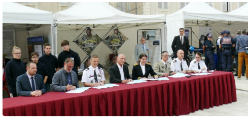
Signature de la convention entre le Foyer Louise Marillac, la préfecture et les services de sécurité.