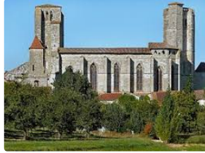
Archéologie, Architecture,et musique.