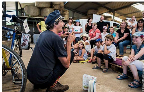
Capture d'écran (150).jpg