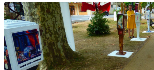
les boîtes à lettre