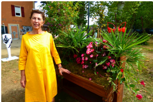
le piano avec les fleurs des jardins de Blandy