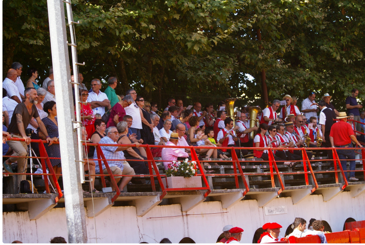
Novillada non piquée de Riscle samedi matin

Deux oreilles , il aurait pu y en avoir quatre