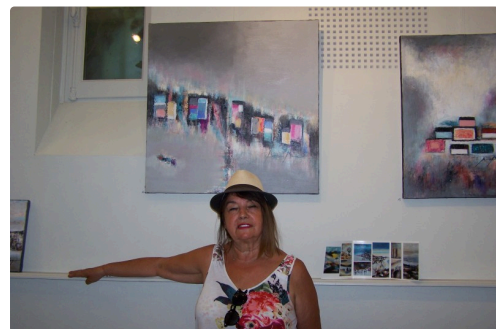
Devant " Imaginaire poétique"

Horaires : lundi 10 h à 12 h 30, mardi /mercredi et vendredi de 16 h à 19 h et jeudi et samedi de 10 h à 12 h 30 et de 16 h à 19 h et dimanche sur demande.