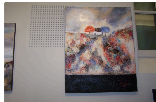
" La maison du peintre"