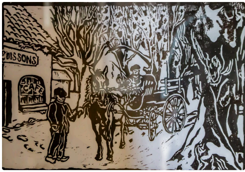
Gravure sur bois