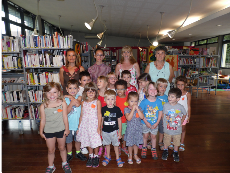
Le centre de loisirs accueilli en deux fois à la médiathèque