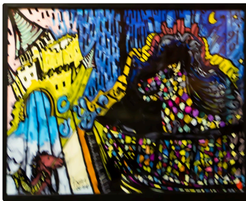
Le petit cheval