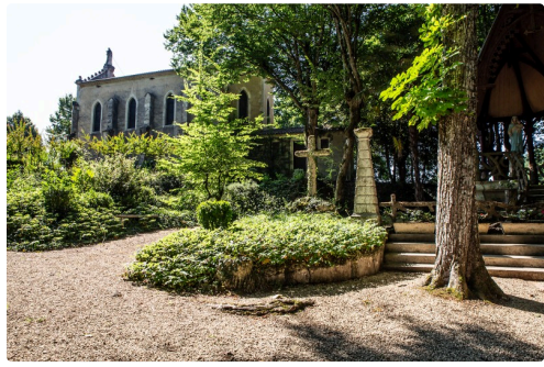
La chapelle du Tonneteau et le jardin en contrebas