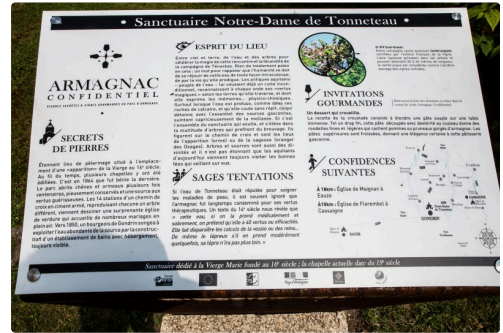
Panneau sur pupitre devant la chapelle du Tonneteau