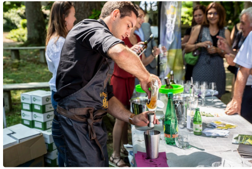
Confection d'un cocktail à la blanche d'armagnac