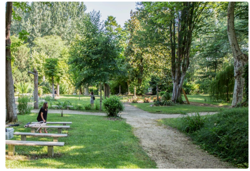
Autre vue du jardin