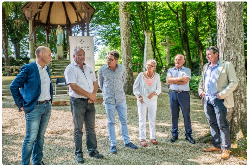
Panneau sur pupitre devant la chapelle du Tonneteau