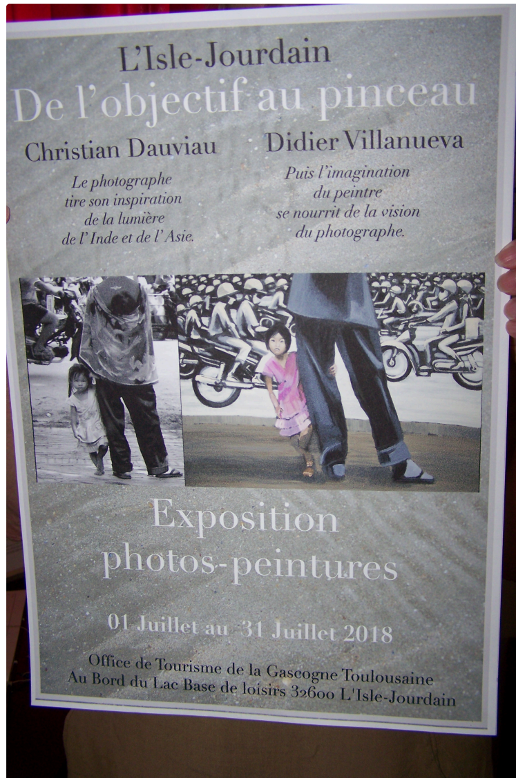
Des oeuvres artistiques par deux regards d'artistes, l'un photographe et l'autre peintre à l'Office de Tourisme de la Gascogne Toulousaine