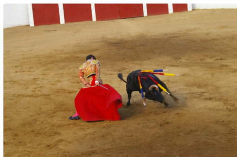
Valentin Oyos Calama toréé proprement ,il a du mal à transmettre de l'émotion