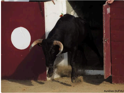
Le novillo du Lartet qui a remporté le premier prix 1 photo Aurélien Duffau