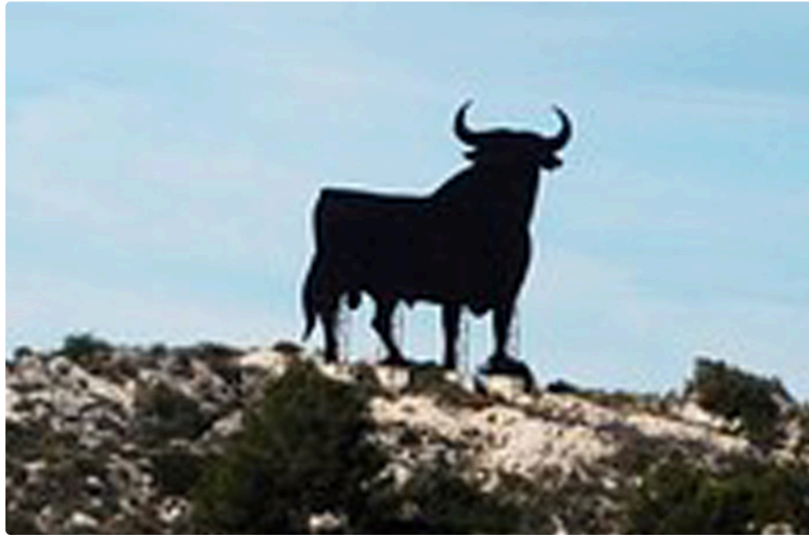
Novillada à Castelnaud