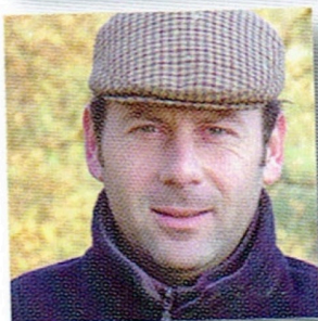
Bonnet père et fils