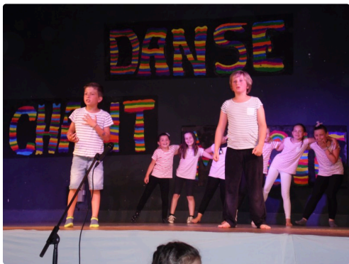
du 23 juin 2018