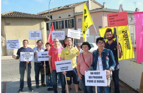
manifestation des Vicois en colère