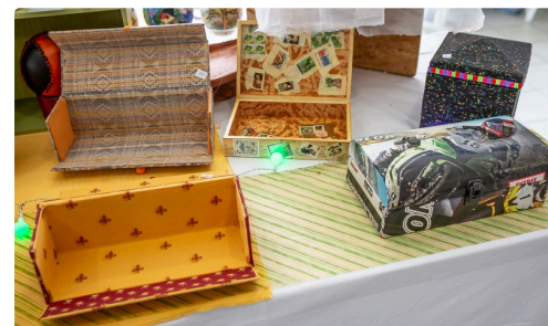
Des boîtes décorées