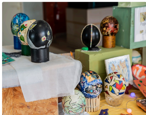
Des œufs d'autruche décorés