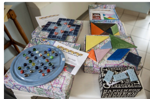
Jeux de société