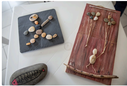
Jeux de cailloux