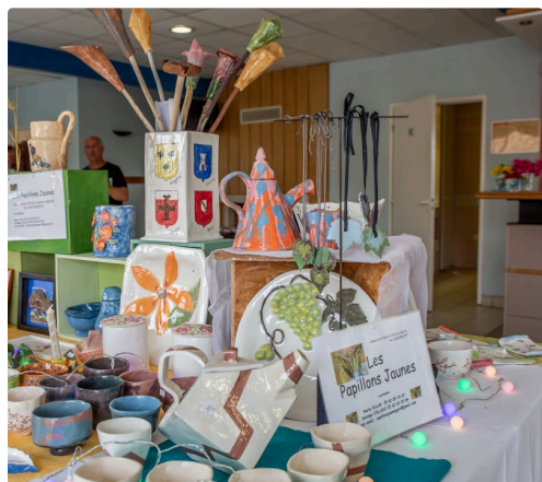
Le coin poterie