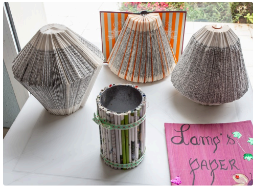
Ce qu'on peut faire avec des livres