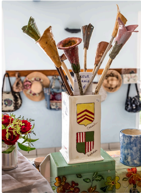
Gros plan sur un vase et ses fleurs de céramique