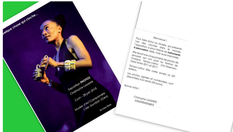
Y a quelque chose qui cloche

Exposition photo de Christophe Lasserre en l'Espace Pierre Lasserre