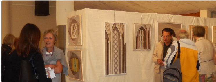
SAINT MARTIN Salon d'art