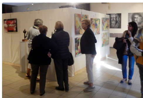
un public qui apprécie