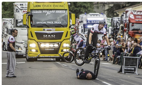
Acrobaties en moto par Urban Trial Show en juin 2017

(1) Historique Tourisme Champion Car - Nouvelle catégorie créée en 2009 pour voitures de tourisme toutes catégories confondues, notamment les véhicules historiques, ce qui supprime les préparations coûteuses. Et assure la prépondérance du pilote sur la machine dans les résultats.