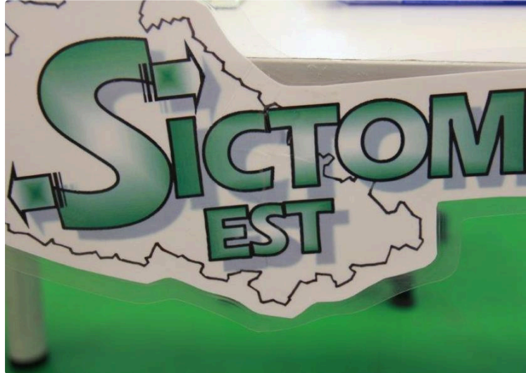
formation au tri au magasin Carrefour Market

Le Sictom Est en partenariat avec Trigone éduque les clients