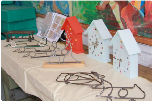
plein d'autres réalisations