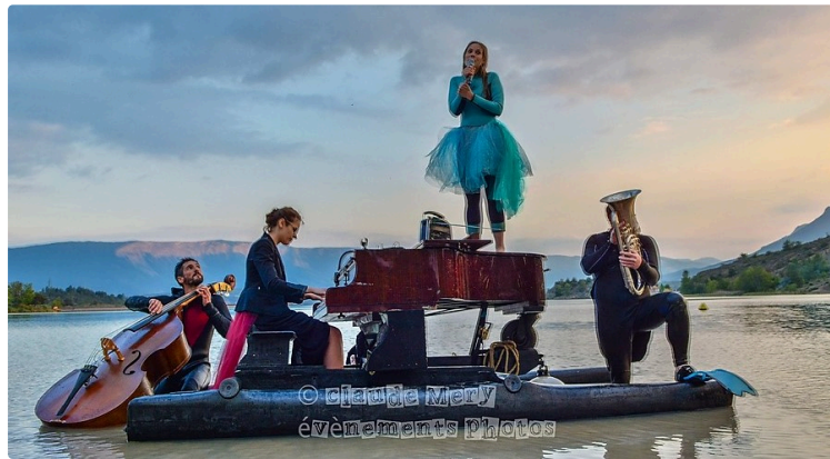
Le pianO du lac : concert flottant

Il passera par l'Isle-Jourdain, Castéra-Verduzan et Marciac