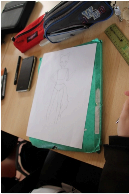
Pas mal du tout !