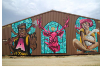
Street' Art'Magnac, un très bon cru

Suite à la 4e édition du Street' Art'Magnac, organisée par l'association ECLA, et qui a eu lieu du lundi 16 avril jusqu'au dimanche 22 avril, l'heure du bilan très positif est arrivé.