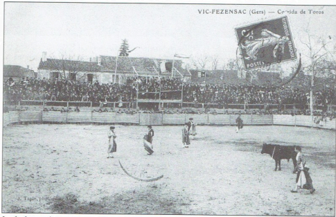
La foule nombreuse occupe les gradins mobiles et les talenquères. Des courses de taureaux ont été organisées au foirail en 1878, 1894, 1904, 1906, 1908...