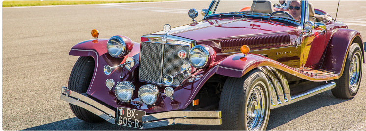
« Classic festival » sur le circuit et en ville

Un flot de voitures anciennes va déferler sur Nogaro