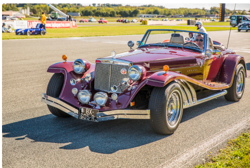
Lors de la parade sur le circuit

Renseignements et inscriptions (c'est moins cher par Internet que sur place) sur le site dédié ( http://www.classicfestival.fr/fr/accueil.php ).