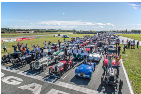
Les voitures sont au départ de la parade sur le circuit en octobre 2014