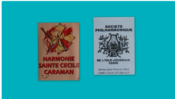
Concert de Printemps

Double concert à la polyvalente Yves Caubet