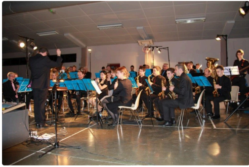
la Société Philharmonique de L'Isle-Jourdain