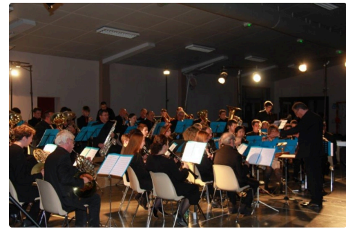
Jean-Louis Salvaire dirigeant la Philharmonique