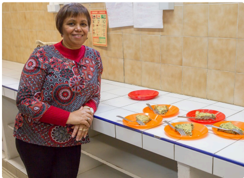
Il n'y a plus qu'à déguster