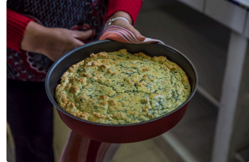
C'est prêt !