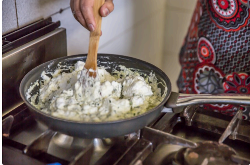
Incorporation des blancs en neige