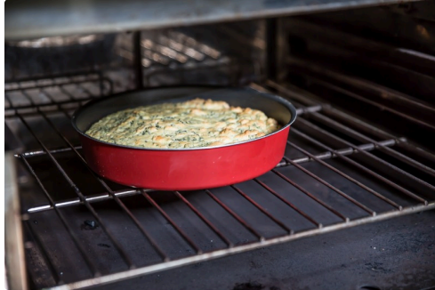
Sortie du four