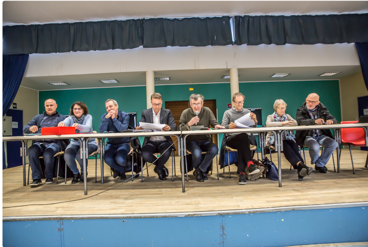
Nogaro – La collecte des ordures ménagères sera plus contraignante

La date de démarrage n'est pas encore fixée