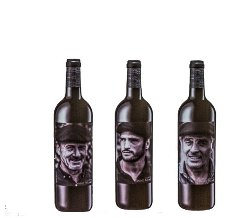
Plaimont Producteurs s'adapte au marché

Un nouveau plan d'entreprise est en chantier