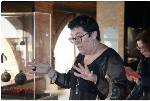
la phénoménale conteuse Véronique Grosjean-Lasserre