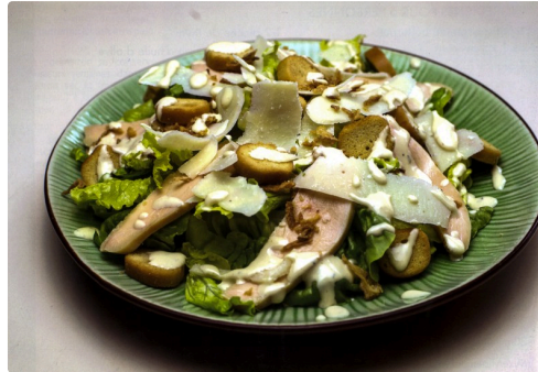
Salade Caesar au poulet