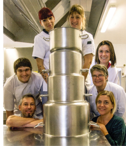
Nogaro - « Des recettes de cantine, ça ne fait pas rêver... »

...mais cette cantine n'est pas ordinaire