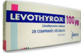
lévothyrox et solutions de remplacement

Pour faire suite aux divers articles parus sur les problèmes du nouveau lévothyrox, provoquant des troubles chez de nombreux utilisateurs.