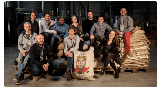
l'équipe Di-Costanzo