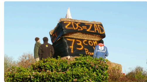
Mise en place des banderoles.