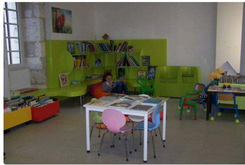
Espace jeunesse de la médiathèque