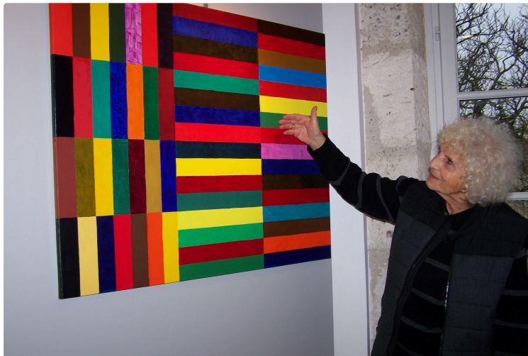
Une envolée de couleurs vives en ces temps hivernaux..L'artiste SLM provoque des ondes positives par le biais de sa peinture !

Photo : L'artiste devant une de ses oeuvres