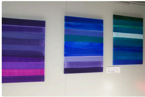
aude machefer artiste peintre 012.JPG