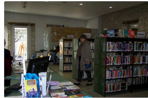
Que de livres pour le choix de l'étagère