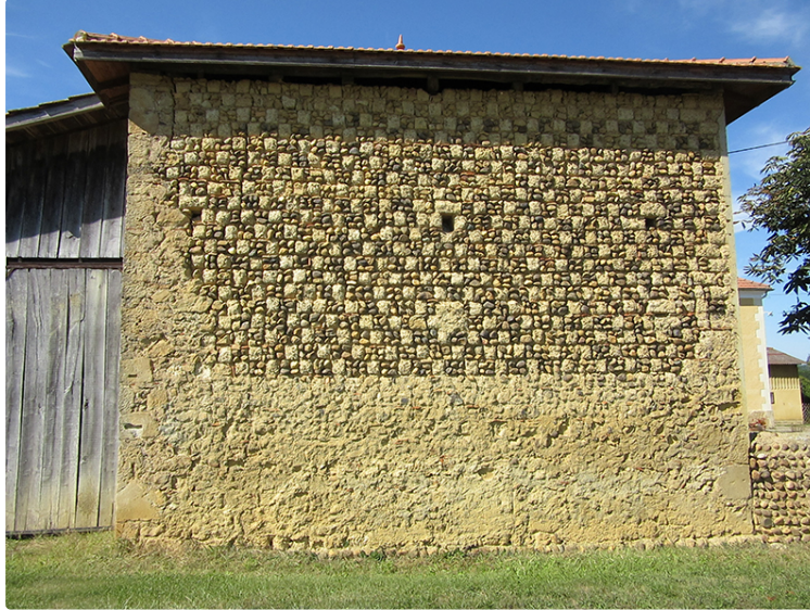
Les murs en damiers livreront-ils leur secret

Plusieurs associations se penchent sur le sujet