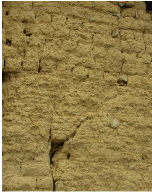
adobe et pisé en bas